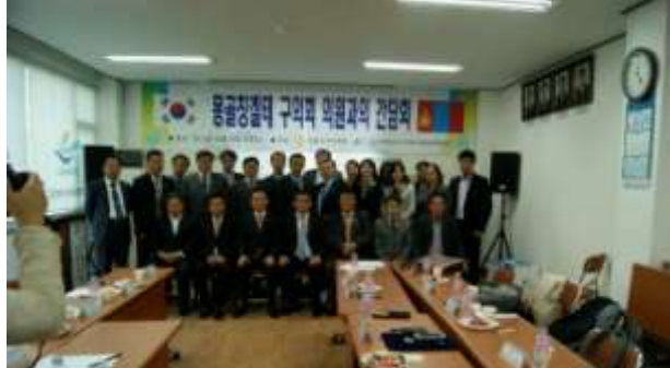
Тайлан бичсэн: Гадаад харилцааны ажилтан